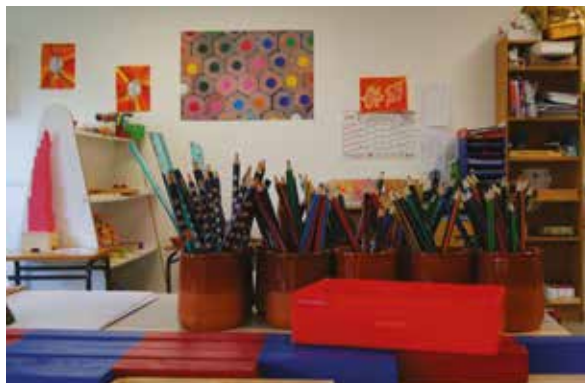
Une étude de faisabilité et de programmation sera lancée cette année pour la réhabilitation de l'école maternelle.

La finalisation de la révision du PLU est en cours, malgré le retard pris avec la crise sanitaire. Ce travail était nécessaire afin de prendre en compte les nouvelles lois entrées en vigueur et le contrat de mixité sociale que nous avons mis en place en partenariat avec les services de l'État et de la Communauté d'Agglomération du Libournais.