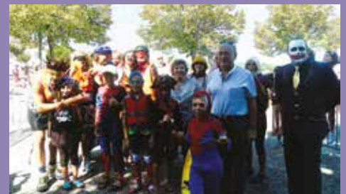
Remise des prix des Mascariders par M. le Maire.

La restauration était digne des plus beaux mascarets : un grand marché gourmand était proposé aux visiteurs, avec notamment du veau et des cochons à la broche, un stand réunionnais "Totolela", ainsi que des stands de glaces, crêpes et diverses possibilités de se restaurer.