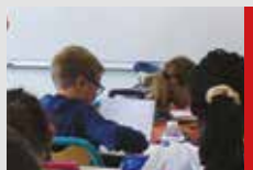
Une rentrée réussie !