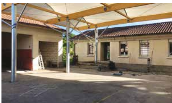
Couvreur, zingueur, chauffagiste, peintre, menuisier, de nombreux corps de métier interviennent durant le chantier.