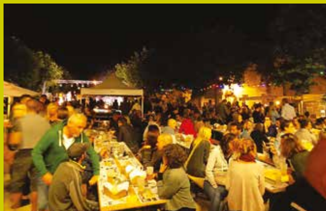
... et de la convivialité.