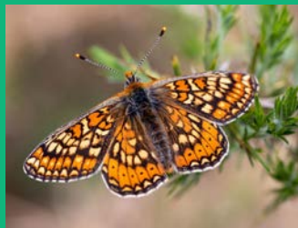
Damier de la Succise