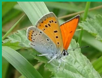
Cuivré des marais

Vous pouvez signaler vos observations de ces espèces près de chez vous ! Pour cela, adressez un mail à l'adresse francois.leger@mtda.fr