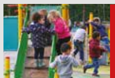
La récré à l'école maternelle.