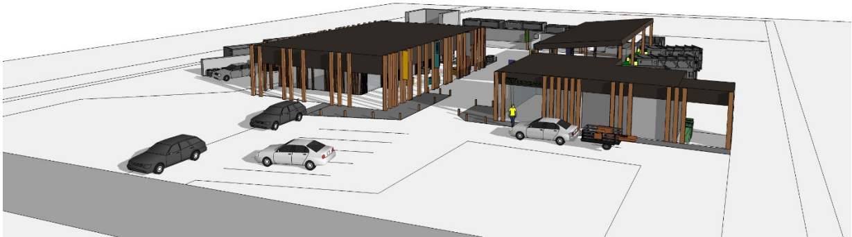
Visuel : Action Architecture – Libourne 49 TER av du Général de Gaulle

L'actuelle déchèterie sur la commune de Vayres étant obsolète, le SMICVAL a fait l'acquisition d'un terrain sur cette même commune pour y construire un nouvel équipement à la façon d'une galerie marchande inversée . Les objets sont déposés, sur le site, dans la thématique à laquelle ils appartiennent, maison des objets et matière, préau des métaux et zone de dépôt au sol ... Dans l'intention de modifier durablement le geste des habitants.